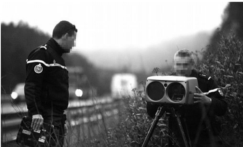
De nombreux excès de vitesse ont été enregistrés sur l'A8 samedi. Image d'illustration Valérie Le Parc

#NICE #FAITS-DIVERS | PAR MATHILDE TRANOY | Mis à jour le 19/07/2020 à 16:13 | Publié le 19/07/2020 à 16:10