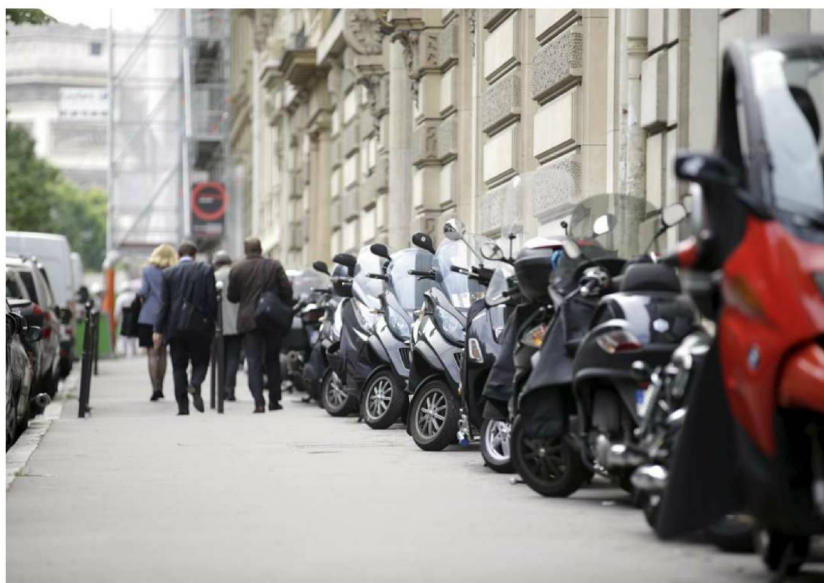
Plus de 100 000 motos circulent chaque jour dans la capitale pour seulement 40 000 places sur la voirie. La Fédération française des motards en colère réclame un cadre légal, d'autant que le gouvernement envisage de faire passer le PV de 35 à 135 €. (LP/Olivier Arandel)

Le stationnement sur les trottoirs est l'infraction commise par