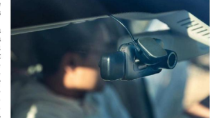
Les ventes de dashcams – de petites caméras placées sur le pare-brise qui permettent de filmer la route – augmentent en France.

À savoir toutefois : pour les besoins d'une enquête, les gendarmes peuvent saisir les données des dashcams, comme c'est le cas des vidéos captées par les téléphones portables, par exemple.