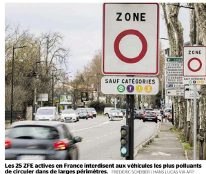
Les 25 ZFE en France interdissent aux véhicules les plus polluants de circuler dans de larges portions.